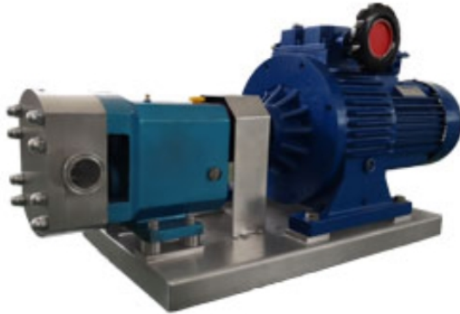
上海莱敦机械设备有限公司 转子泵专业制造商

有哪些设备可以输送粘稠的流体呢？我们输送流体一般都是用泵类产品，当输送像水一样的流体用离心泵，齿轮泵就完全可以解决，但要输送有一定粘度的流体，如糖浆，乳胶等就不能采用了。那么输送粘稠流体需要什么泵来完成呢？输送粘稠流体可用柱塞泵， 转子泵 ，螺杆泵等容积式泵，其中柱塞泵输出压力ZUI高，但造价较高，维护成本高。 转子泵 输出压力相对较低，但价格适中，易损件少。螺杆泵输出压力相对转子泵高，但其中的关键零件-定子较容易磨损，维护成本相对 转子泵 较高。 转子泵 制造商-上海莱敦机械设备有限公司。